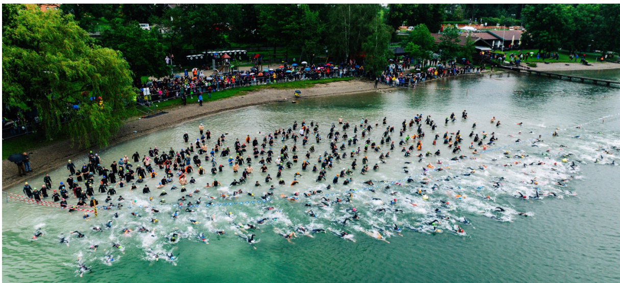
Für rund 1.300 Sportler:innen steht das Tegernseer Tal am 5. Juli 2026 als traumhafte Triathlon-Location bereit.

Der SCOTT Tegernsee Triathlon startet am 5. Juli 2026 mit neuem Schwung in die Saison: Das junge Team von Mission Homerun übernimmt die Organisation des etablierten Ausdauer-Events und gewinnt mit SCOTT einen international führenden Multisport-Ausrüster als neuen Titelsponsor. Ein klares Signal für Aufbruch und Weiterentwicklung – und das mit voller Rückendeckung der Community. Rund 1.300 Athletinnen und Athleten sicherten sich direkt nach Anmeldestart ihre Startplätze, das Event war in kürzester Zeit ausgebucht.